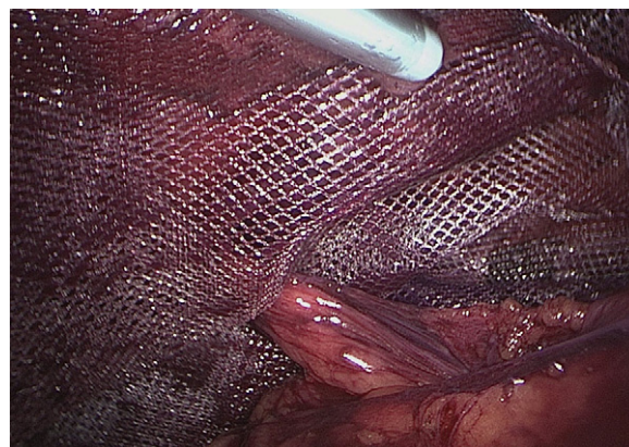
Figura 2 – Fijación de la malla mediante adhesivo tisular sintético en una hernioplastia laparoscópica a través del aplicador-dosificador.

Los pacientes se han analizado en función de su tratamiento quirúrgico, con o sin suturas y vía de abordaje. Para la descripción de variables cuantitativas se empleó la media y la desviación típica; para variables cualitativas, la proporción. Para el estudio de la normalidad de las variables cuantitativas se empleó el test de Kolmogorov-Smirnov. Para la comparación de medias cuando la variable cuantitativa no seguía una distribución normal se empleó el test de la U de Mann-Whitney; y el test de la t de Student para las variables cuantitativas con datos de distribución normal e igual varianza entre los 2 grupos. El test de la Chi 2 con corrección exacta de Fisher se empleó para el análisis de datos cualitativos. Como significación estadística se ha considerado un valor de p < 0,05 . Todos los cálculos se han hecho usando el programa estadístico SigmaStat (Jandel Scientific, Carlsbad, CA, EE. UU.).